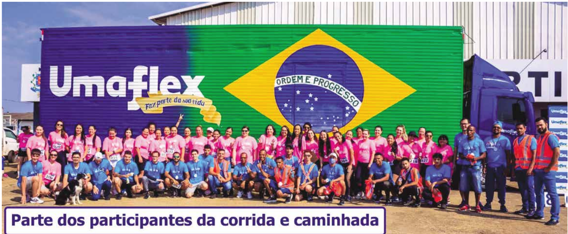
Parte dos participantes da corrida e caminhada