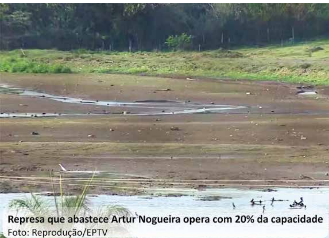
Represa que abastece Artur Nogueira opera com 20% da capacidade

Município estabeleceu racionamento no início deste mês, quando nível do reservatório estava em 40%.