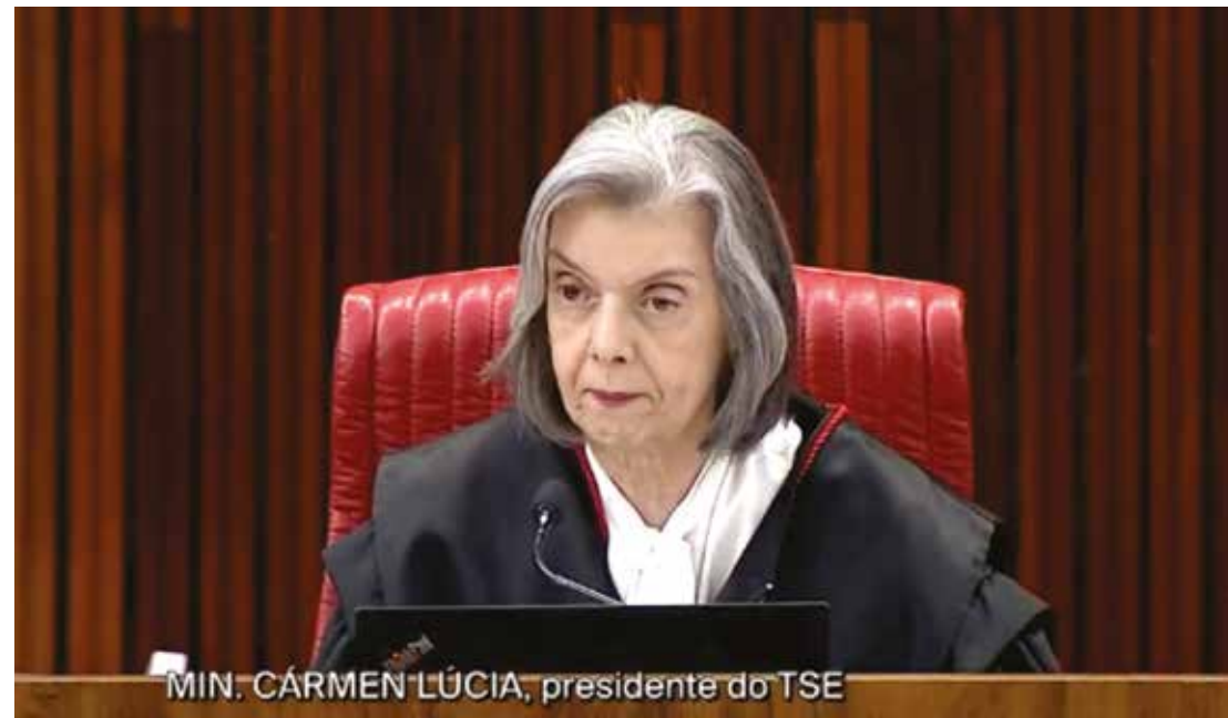
MIN. CÁRMEN LÚCIA, presidente do TSE

nas" e "incivis" que impõem aos cidadãos cenas "abjetas" e de "pugilato".